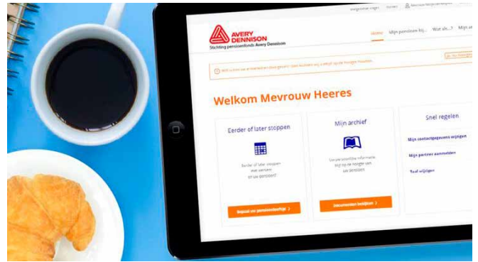
Impressie van ons pensioenportaal, dat nog in aanbouw is.

In de (verre) toekomst gaat de digitalisering nog een stapje verder, bijvoorbeeld online zelf je pensioen aanvragen. Dat duurt nog even. ”Maar je kunt nu zelf al zaken, of met je partner samen, uitvogelen zonder direct met de pensioenbeheerder om tafel te hoeven. Dat maakt het minder zwaar.” En ook best leuk, pleit Iris: “Pensioen is niet saai. Hoe fijn is het als je weet dat je straks rond kunt komen? Of in elk geval: dat je precies weet waar je aan toe bent – en zelf keuzes kunt maken!” ■